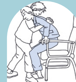
Contrapeso del cuerpo