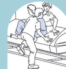
Utilización de apoyos