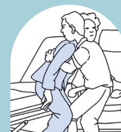
Manipular cerca del tronco